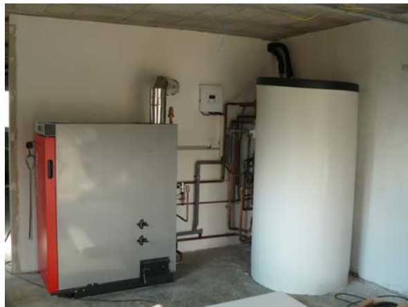
Chaudière bois bûche semi-automatique