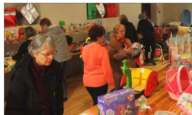
De nombreux stands proposeront jouets et vêtements.

Le pucier du Sou de l'école Debelle (centre-ville) se tiendra le samedi 27 septembre dans la cour de l'école élémentaire. Porté par les parents d'élèves bénévoles, ce pucier vise à soutenir les projets scolaires de l'année. Les exposants pourront s'installer à partir de 6 h 30 et l'ouverture au public se fera à 8 h jusqu'à 16 h. Buvette et restauration sur place, et entrée gratuite.