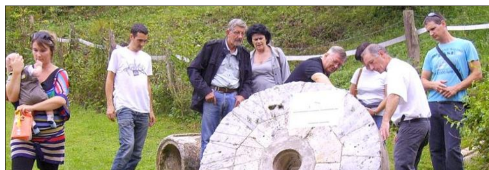
Quelques visiteurs devant la meule.

Ce sont 230 visiteurs qui ont découvert ou redécouvert le site et l'histoire datant du XV e siècle du moulin rose, le week-end dernier en l'occasion des journées du patrimoine. En effet depuis plusieurs