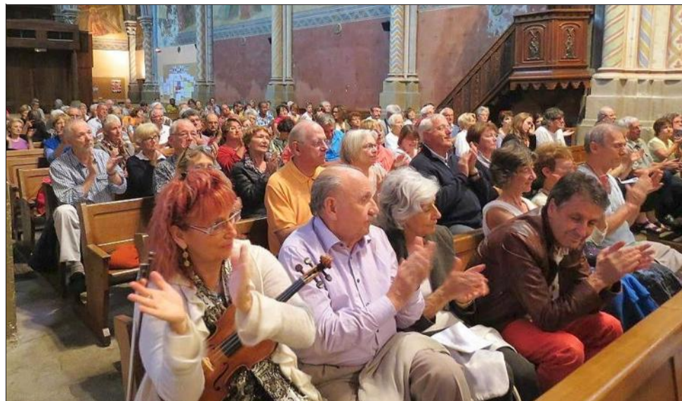
De très nombreux auditeurs pour ce concert unique proposé par l'Adov.