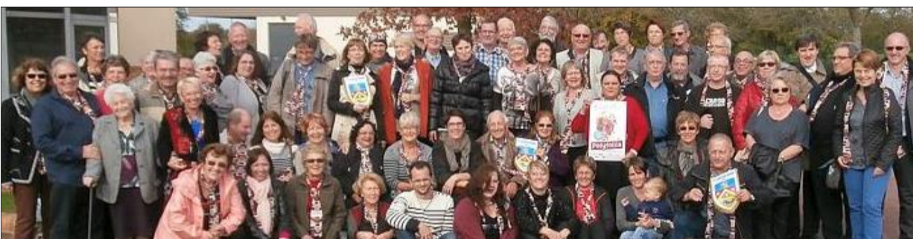
Un week-end de quatre jours intense et convivial, riche en rencontres et en souvenirs pour les choristes saint-clairois.

Polyfolia est un festival international de chant choral créé en 2004 à de Saint-Lô dans la Manche : c'est le rendez-vous incontournable des fans de chant choral de toute la France et d'ailleurs. Il a eu lieu du 21 au 26 octobre et