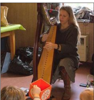
Stimuler l'imaginaire par la musique.