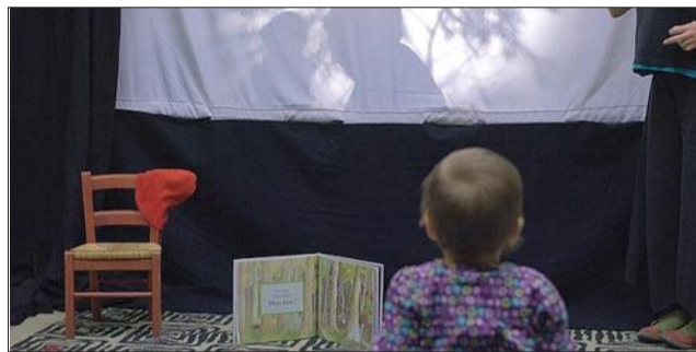
Des spectacles et des ateliers seront proposés.