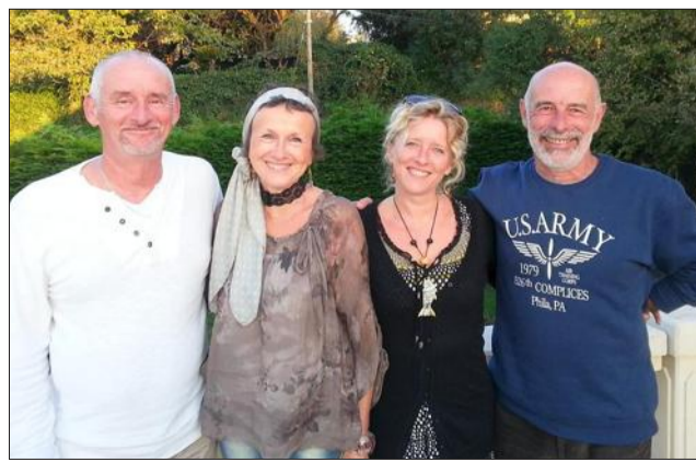
La compagnie de la Chrysalide se produira à Maclas au profit de l'association.

D'autre part, la compagnie Chrysalide jouera au profit de l'association. Elle va présenter à Maclas une pièce de Florian Zeller, "La Vérité". Une comédie moderne dont le rôle principal a été écrit pour Pierre Arditi. La compagnie donnera deux représentations le same-