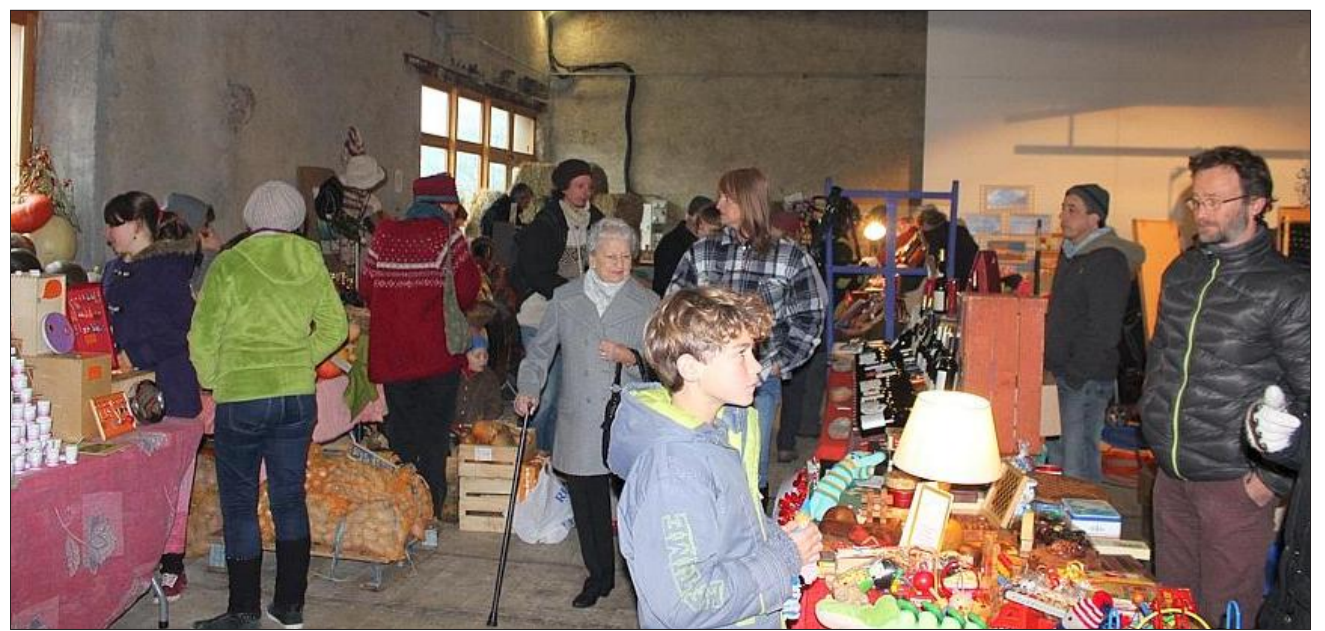
Ce marché de Noël a connu une excellente fréquentation