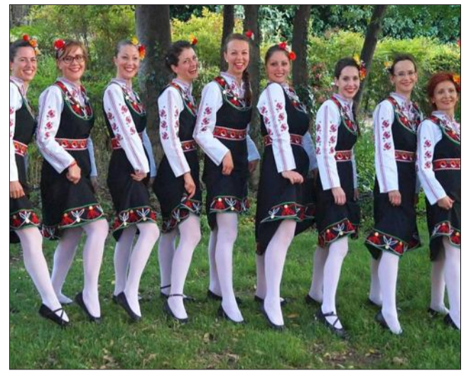
Le groupe Ludi Mladi ("Jeunes et Fous") est une troupe de danses folkloriques bulgares créée en janvier dernier. Il est composé de danseurs non professionnels, essentiellement des étudiants de la région languedocienne.

Samedi 13 décembre à 20 h 30 au foyer municipal. Pour mieux les connaître : http://polyfemna.com .