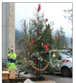
C'est parti pour la féerie de Noël.