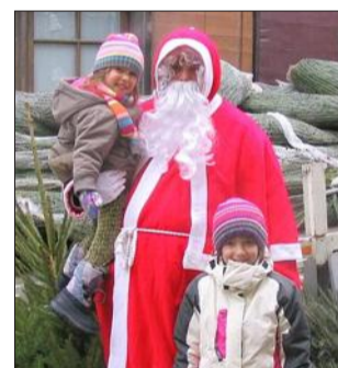
Il sera là à partir de 19 heures, pour la traditionnelle distribution des friandises.

du collège Marcel-Cuynat, SOS Récré, les sapeurs-pompiers, l'association Menthe abricot cerise de Roissard, les Amis de Zake). Les visiteurs trouveront aussi des crêpes et gaufres, barbe à papa, diots de Savoie, chocolat, vin et marrons chaud, les odeurs de cannelle du Sou des écoles, des dégustations d'huîtres avec un petit vin blanc, par Katie et Frédéric. Quant au programme, il débutera à 17 h 15 avec une déambulation à partir du Granjou, une exposition sous le pont de la RD 1 075 (ombres chinoises et messages), puis dans le parc Louis-Samuel (derrière la mairie), des percussions et contes à 18 h, lâcher de lanternes (toujours derrière