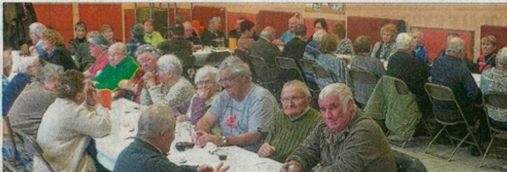
Une soixantaine d'adhérents de Joyeuse amitié des Terres Froides se sont retrouvés à la salle des fêtes pour un repas purée, boudin, entièrement confectionné par les bénévoles.

Une nouveauté cette année les rapilles ont accompagné la salade. Très apprécié de tous, la journée s'est déroulée dans la bonne humeur et en musique avec quelques airs d'harmonica de l'ami Joseph. Toutefois une pensée en l'absence d'un ami cher, Gérard, trop tôt disparu.