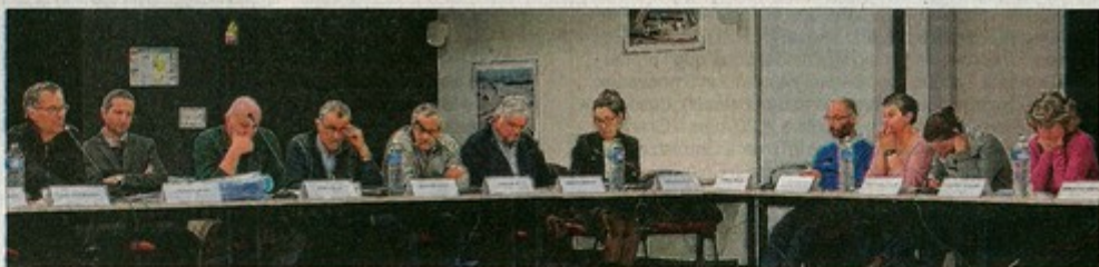
Le conseil communautaire accentue ces efforts au développement économique, source de richesse pour le territoire.

Lors du dernier conseil communautaire à Colombe, le vote du budget 2015 était à l'ordre du jour.