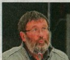
Dominique Roybon présente le budget 2015, et la gestion rigoureuse de l'argent public.