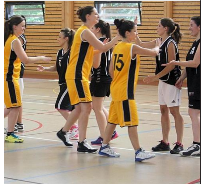
Les filles ont donné un beau spectacle pour l'anniversaire de l'USSB.