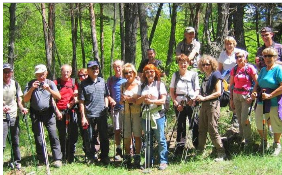
Le club de randonnée de Noyarey a découvert la vallée du Bès.