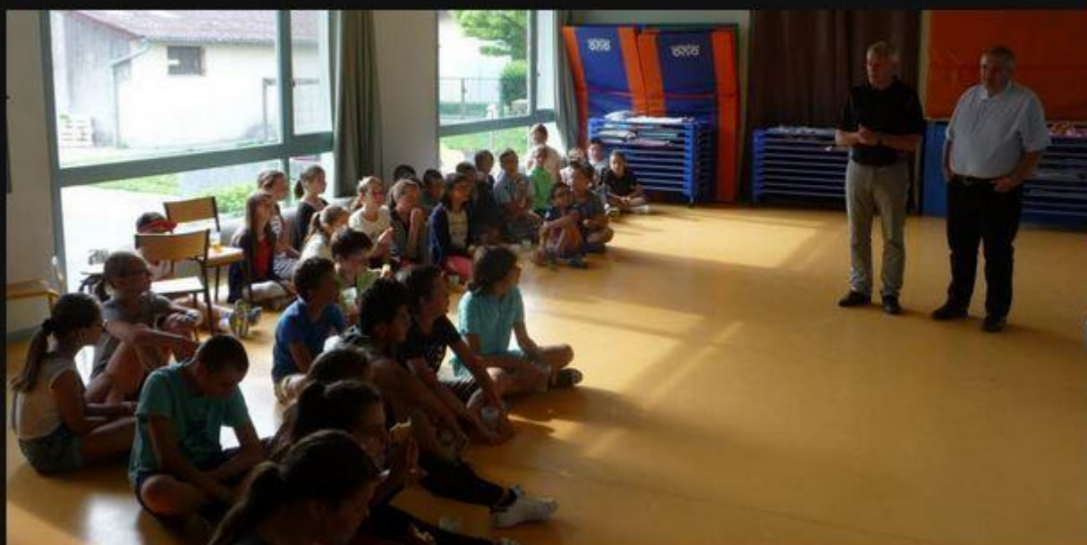
Les maires des deux communes accueillent les enfants.