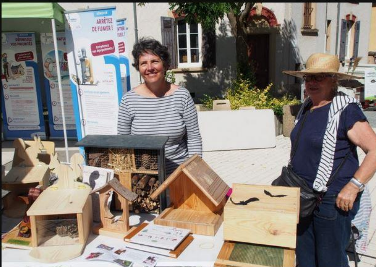
Mention spéciale pour le stand Troc aux plants qui n'a pas désempi.