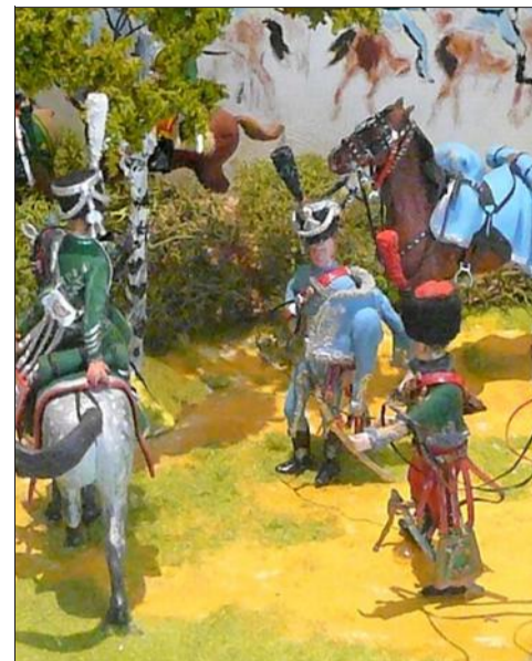
Vous pouvez notamment admirer les figurines fabriquées et mises en scène par Pierre Pujos.