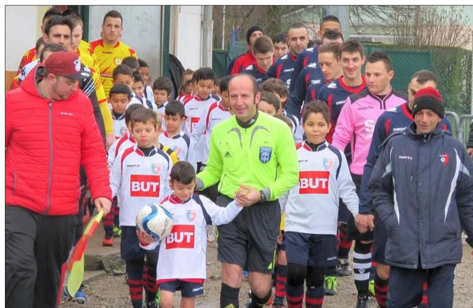
Une entrée sur le terrain avec les enfants de l'école de football du club.

Pour le premier match retour en championnat de promotion d'Excellence, l'équipe fanion recevait dimanche l'AS Ver Sau (troisième du championnat).