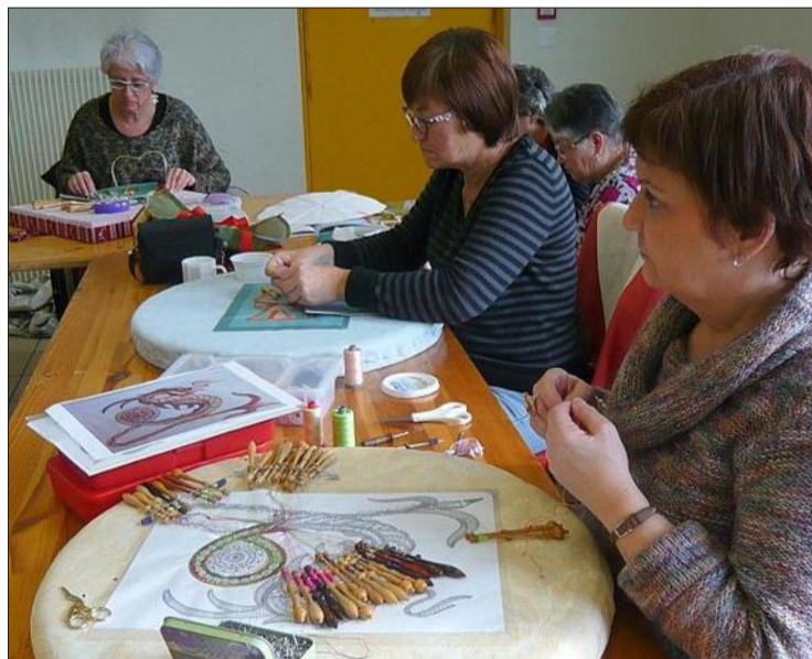
Les dames croisent les fuseaux.

Vous trouverez très vite les dentellières : elles seront dans leur costume bleu gentiane.