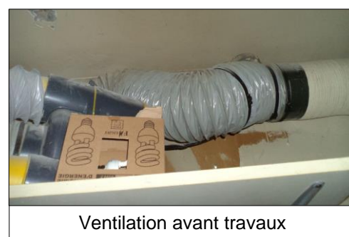
Ventilation avant travaux