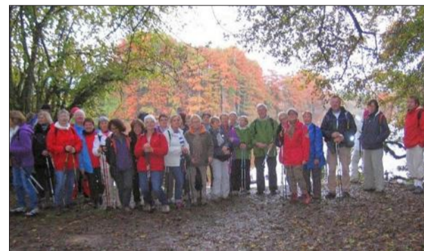
Les randonneurs ont vu un magnifique spectacle en pleine nature.

L'automne a habillé de leur tenue d'or les cyprès chauves de l'étang de Boulieu et comme un rituel, les randonneurs de Rand'Aves leur ont rendu visite. Ils étaient 35 sur 67 adhérents à affronter la bruine pour se