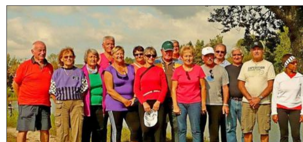
Le groupe des marcheurs a apprécié cette belle journée au cœur des étangs de Genevray.

Par une belle journée ensoleillée, le groupe des retraités randonneurs s'est expatrié dans le département de l'Ain, aux abords de la commune de Thézillieu, afin de s'adonner à leur détente favorite. 3 circuits étaient à la disposition du groupe qui choisissait son itinéraire. Départ de la cabane des