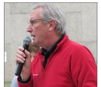
Un représentant des Gilets jaunes de l'Isle-d'Abeau.

« Il faut arrêter de parler uniquement de ce qui ne va pas. Passons aux choses positives. Je suis présidente d'une association qui s'occupe des centrales villageoises du côté de Chèzeneuve. Chacun d'entre nous peut œuvrer pour la transition énergétique. C'est une occasion à ne pas rater. J'encourage tout le monde à passer dans le camp de ceux qui font avancer les choses. »