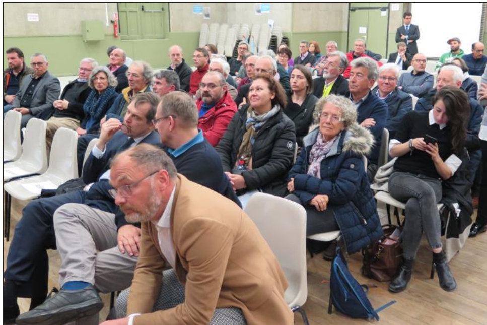
Le Grand Débat national se poursuit normalement jusqu'au 15 mars. C'est d'ailleurs la date de la dernière réunion (fiscalité et dépenses publiques) prévue dans le secteur : elle se déroulera de 19 à 22 heures, à la salle des fêtes de Ciers, aux Avenières Veyrins-Thuellin.