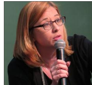
Marjolaine Meynier-Millefert a animé le débat.