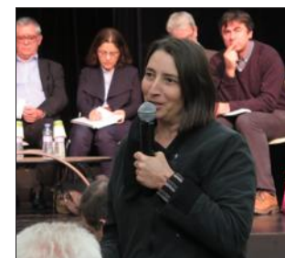
Une représentante des centrales villageoises.