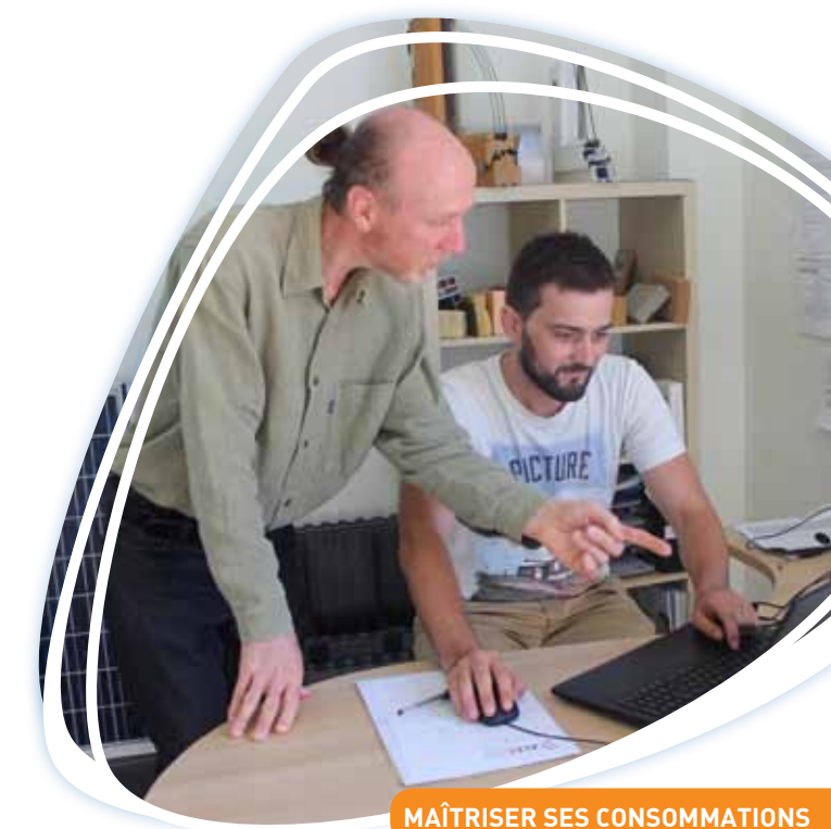
Juillet 2017

Pour des informations sur la campagne Mur|Mur2, contactez-nous par téléphone au 04 76 14 00 10.